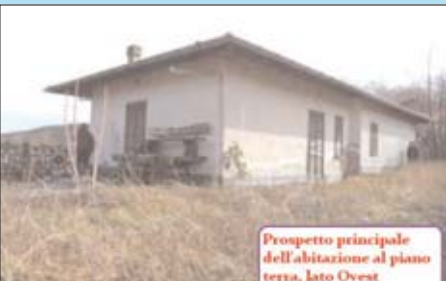
Prospetto principale dell'abitazione al piano terra, lato Ovest

maggiori informazioni su www.asteannunci.it